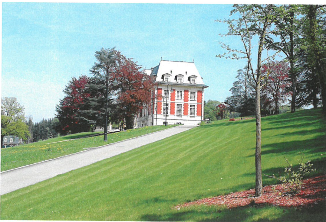
Le Domaine de Guilé, à Boncourt, fera désormais le bonheur de la Fondation Les Castors